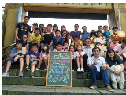
說明：小小創業家展攤活動