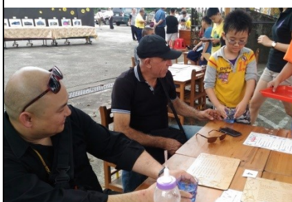
說明：小小創業家展攤活動