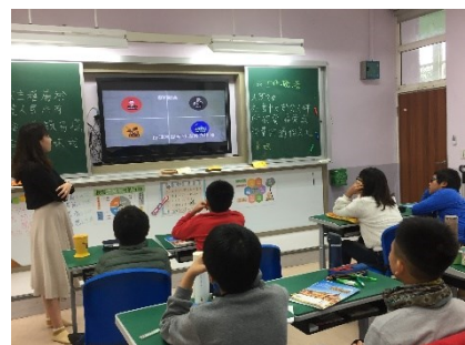
說明：了解敘利亞戰爭原因