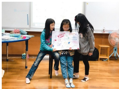
說明：學生整理繪本心智圖