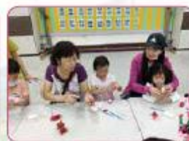
讓孩子在愛與 陪伴中成長