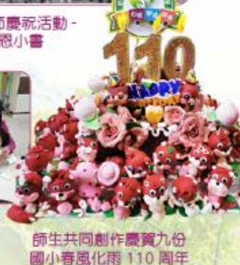
師生共同創作慶賀九份 國小春風化雨 110 周年