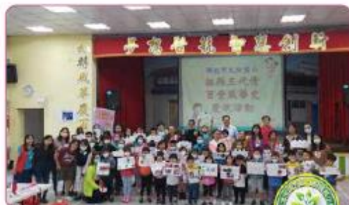
2020.10.19 重陽節慶祝活動 - 祖孫三代情感恩小書