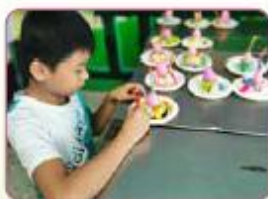
孩子期待送給從小 照顧自己的祖母