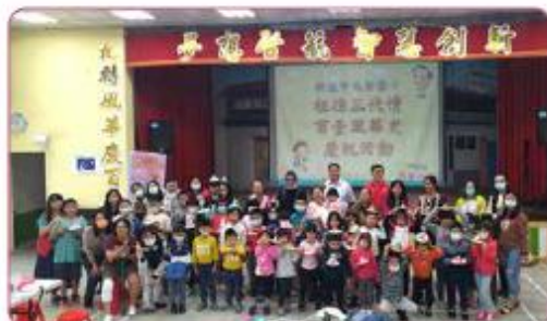
2020.10.19 重陽節慶祝活動 - 祖孫三代情祝賀禮