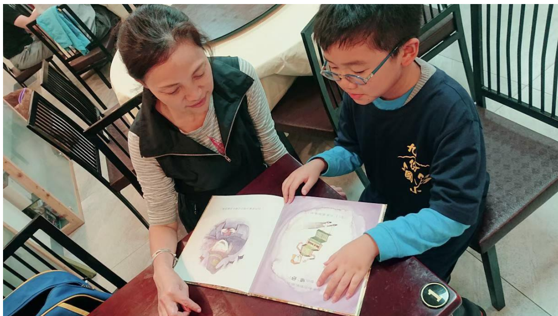
家裡推行家庭閱讀實景