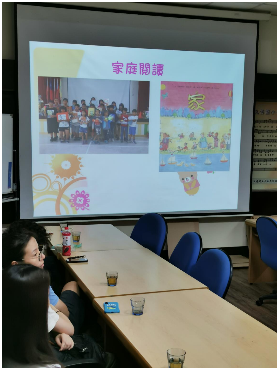
說明家庭閱讀的重要