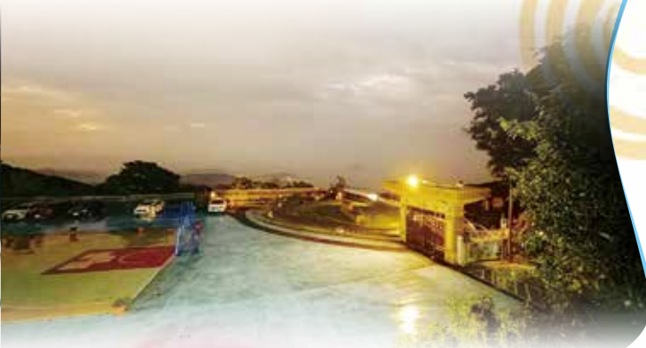
夜晚照明讓操場顯得更佳安全，易於活動