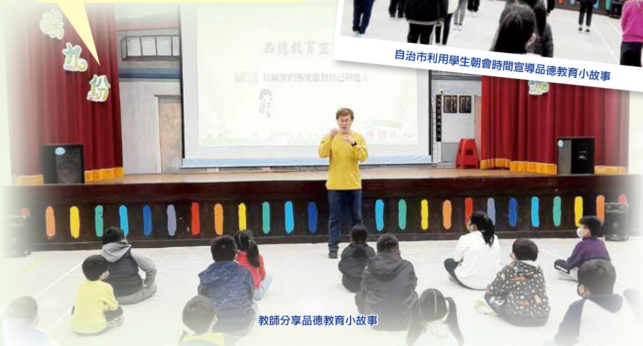
教師分享品德教育小故事

全面建立正面的校園文化是推動品德教育的重要一環。學校應該強調共融性，讓每個學生都感受到被尊重和接納的重要性。透過鼓勵積極行為、分享正面故事，培養學生的良好價值觀。學校會安排每周學生朝會時間，由校內學生自治會成員們輪流上台分享品德教育小故事，促進同儕互動，共同建立積極向上的校風。