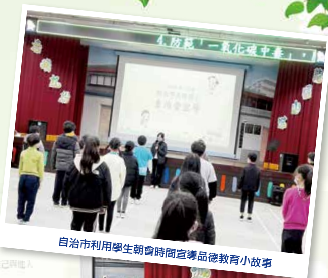
自治市利用學生朝會時間宣導品德教育小故事

在小學階段，品德教育扮演著至關重要的角色，不僅影響學生的行為舉止，更是培養未來社會公民的基石。因此，學校在推動品德教育時，採取以激發學生的興趣和積極性，使九份的孩子們能夠在融洽的環境中發展出積極的品德特質。