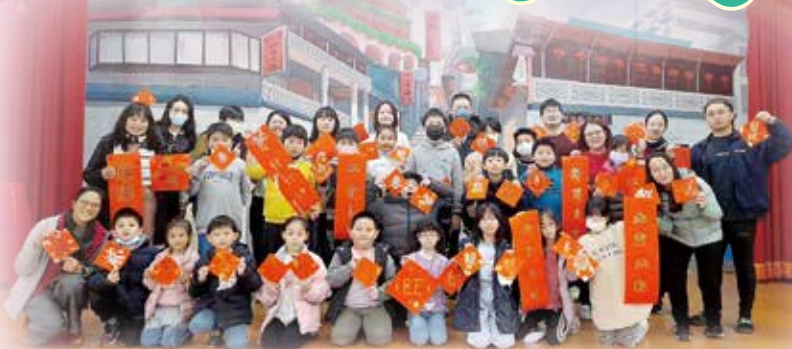
智慧九份樂學溫馨的大家庭