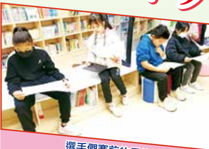
選手們賽前的最後準備