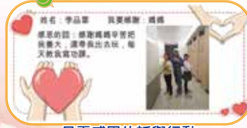
品霏感恩的話與行動