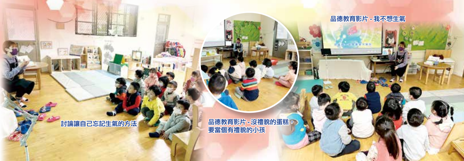
品德教育影片-我不想生氣