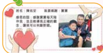
佑安感恩的話與行動