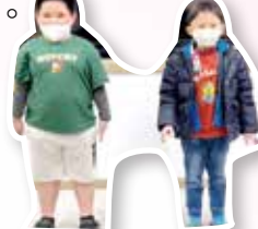
昕皓、景亮上台發表