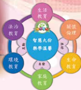
九份品德教育架構圖