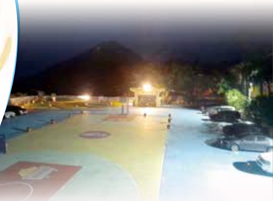
夜晚照明讓操場顯得更佳安全，易於活動

九份國小位於山區，每到秋冬季易起霧下雨，加上天黑時間也較夏天來得早，往往還不到課輔班的放學時間，天色已是一片黑暗。為了全校師生的安全及活動便利，學校方面除了將校內照明時間延長至夜間八時，也在今年透過九份老街協會的經費贊助，得以更新老舊的燈具設備，加裝校門口和圍牆上的照明燈具，不僅解決門口道路昏暗的問題，同時照亮校園裡每一處角落，提供師生良好安全的校園生活環境。